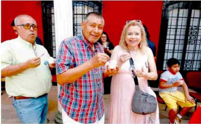
Numerosas familias llegaron ayer al Museo O'Higginiano y de Bellas Artes para participar de la atractiva jornada.

Desde su inicio en 2020, Museos en Verano ha crecido como una de las