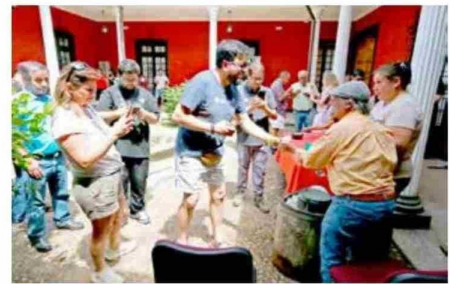
Los numerosos asistentes disfrutando de los helados de nieve.