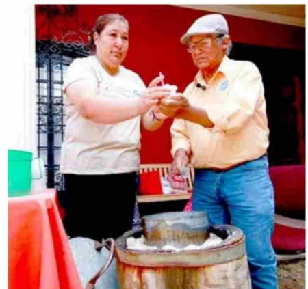
Una tradición nacida en Vilches, y que se ha extendido por más de 150 años.