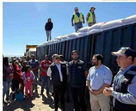
LA PRÓXIMA ENTREGA DE AYUDA DE EMERGENCIA POR PARTE DE INDAP, CONTINUARÁ EN LAS COMUNAS DE COLLIPULLI, ERCILLA Y PERQUENCO.