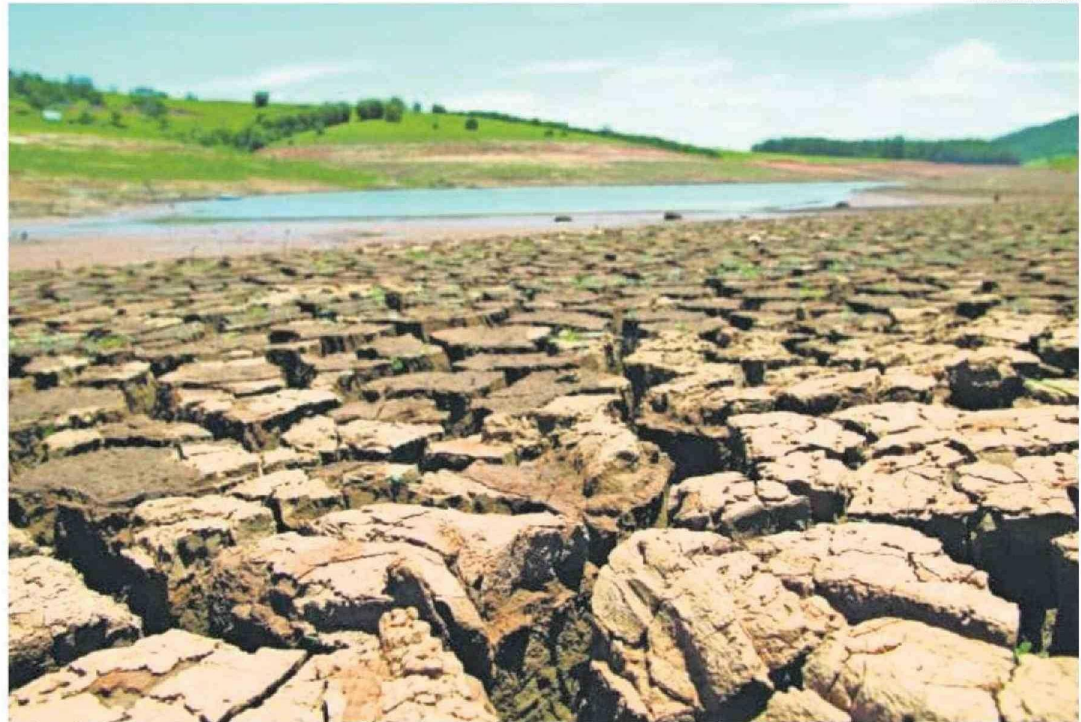
SEGÚN TEMÁTICA, EL 68,5% DEL GASTO EJECUTADO EN LA REGIÓN CORRESPONDÍO A PROYECTOS RELACIONADOS A PREVENCIÓN DE DESASTRES, AGUAS LLUVIAS O CONTROL ALUVIONAL.

Para elaborar el segundo informe enviado al Congreso Nacional se analizaron 3.075 proyectos de inversión del sector público ejecutados durante el año 2022. De estos, 416 iniciativas involucran $258.888 millones distribuidos entre acciones de mitigación y/o adaptación a este fenómeno a nivel nacional.