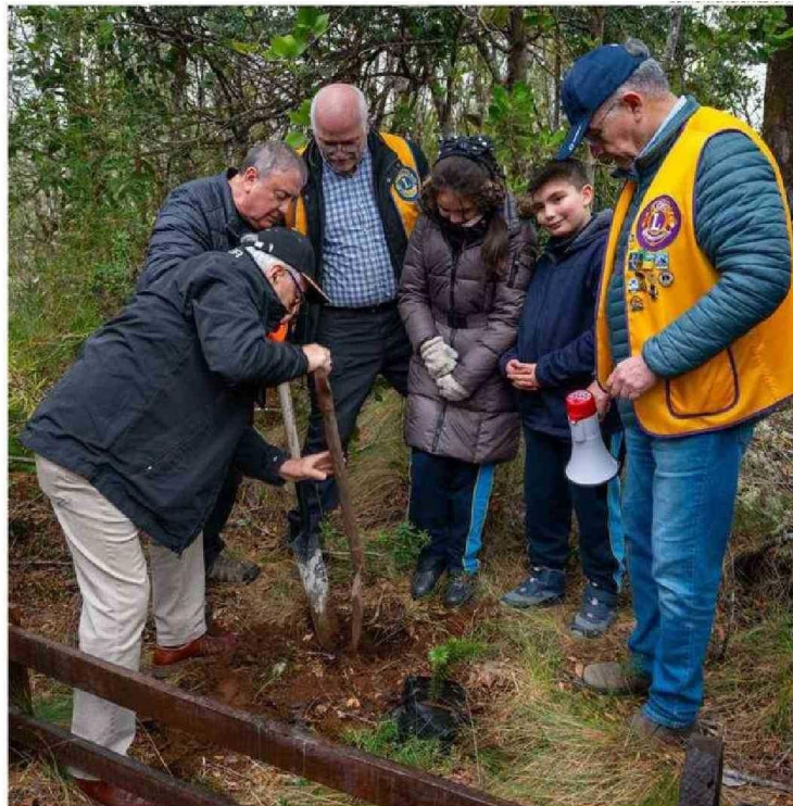
LA INICIATIVA FUE ABIERTA A ESTUDIANTES DE TODA LA UNIVERSIDAD Y COMUNIDAD EN GENERAL Y CONTEMPLÓ LA REFORESTACIÓN DE 700 ARAUCARIAS DE 3 AÑOS DE EDAD.

La iniciativa fue abierta a estudiantes de toda la universidad y comunidad en general y contempló la reforestación de 700 Araucarias de 3 años de edad, cuyas semillas fueron generadas por una planta madre ubicada en el mismo Bien Nacional Protegido, de ahí -explica el académico Rubén Carrillo- quien encabezó la reforestación, cerca de 400 nuevas especies fueron plantadas y otras 300 dispersadas en sectores y predios aledaños para recuperar su presencia fortaleciendo así acciones de divulgación y vinculación con el medio.