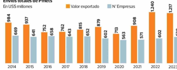
Envíos totales de Pmets En US$ millones