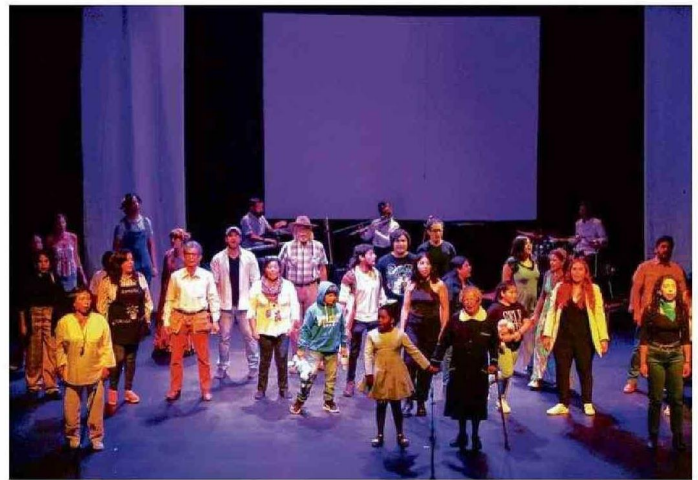
EN EL MARCO DE LOS 50 AÑOS DEL GOLPE MILITAR, BELMAR Y SUS ALUMNOS PUSIERON EN ESCENA LA OBRA "VOCES POR LA MEMORIA".