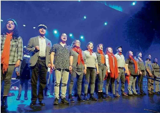
EL ESPECTÁCULO "EL CANTO QUE NOS DEBEMOS", MONTADO POR EL ENSAMBLE VOCAL COMUNITARIO, SE PRESENTÓ EN EL TEATRO MUNICIPAL DE SAN JOAQUÍN EN MARZO DE 2023.

Título: El talentoso director musical las artes que acerca el canto y escénicas a los sanantoninos