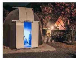
OBSERVATORIO TAGUA TAGUA. Mezcla astronomía y vinos. En los domos proyectan material didáctico 3D de elaboración propia.

los 7 años fabricó su primer telescopio. En 2014 montó el primer observatorio móvil en Chile, y ahora espera con su esposa replicar la experiencia del Observatorio Tagua Tagua en Mendoza, donde residen con sus hijos.