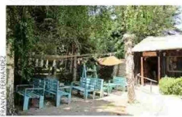
ACOGEDOR. La entrada al quincho de Uva Dulce: un buen sitio para hacer una pausa con un café.