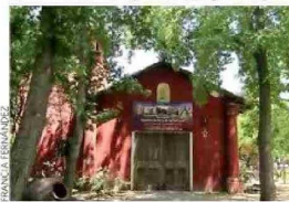
COLONIAL. La capilla está en la única plaza chilena que, dicen, mantiene su diseño histórico.

El británico se interesó por el espacio desde niño, en Inglaterra, al punto que a