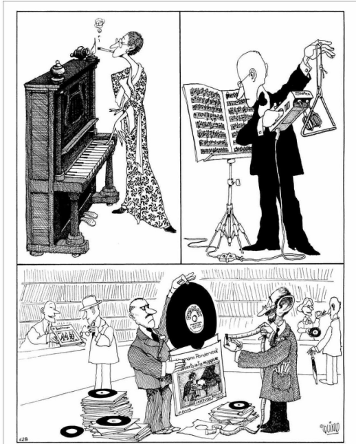
En la muestra hay obras en varios formatos.

“Quino en la música” presenta 120 dibujos del creador de Mafalda en la UC. La muestra temática facsimilar va en paralelo a la de originales que se exponen en España y que dan cuenta de cómo y cuánto el autor argentino conocía el universo musical.