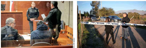
Además de la reunión por la crisis de seguridad encabezada por la ministra del Interior, Carolina Tohá, junto a los máximos responsables de la PDI y Carabineros, hubo avances en los casos más graves. Se realizó la formalización del único imputado por el crimen de cuatro jóvenes en Quilicura, quien quedó en prisión preventiva. En cuanto a la balacera en Lampa que terminó con cinco fallecidos, la fiscalía indaga un arma que fue hallada entre la vegetación.