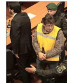
Cumplió los 45 días de reclusión que obligan a nombrar sucesor.

A Jadue se le acaba el plazo para no perder la alcaldía y el PC se decanta por un hombre de confianza del edil para reemplazarlo | C 5