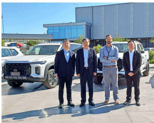
Maxus T60, la camioneta ícono de la marca en Chile.