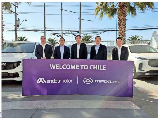
Ejecutivos de Maxus y Andes Motor suscriben la renovación de la representación.