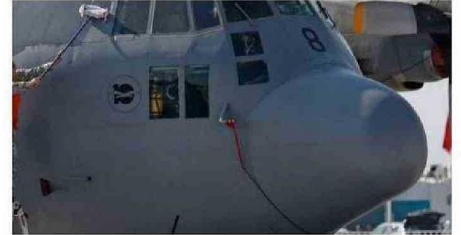
UN AVIÓN HÉRCULES C-130 COMO EL SINIISTRADO.