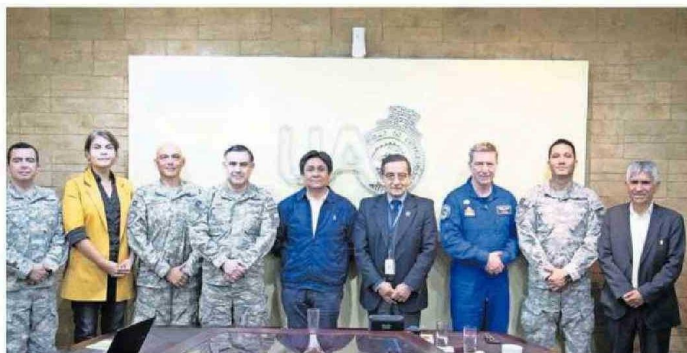
REPRESENTANTES DE LA UA, FACH Y EL GOBIERNO REGIONAL SE REUNIERON PARA COORDINAR EL PROYECTO.

Es por ello que durante estos días se realizó una reunión en la Universidad de Antofagasta (UA), casa de estudios que tendrá la misión de enfocarse en el desarrollo de capital humano y de los diseños de laboratorios para la construcción y operación de satélites de comunicaciones, gracias a la experiencia de sus centros de Investigación, Tecnología, Educación y Vinculación Astronómica (Citeva) o de Fisiología y Medicina de Al-