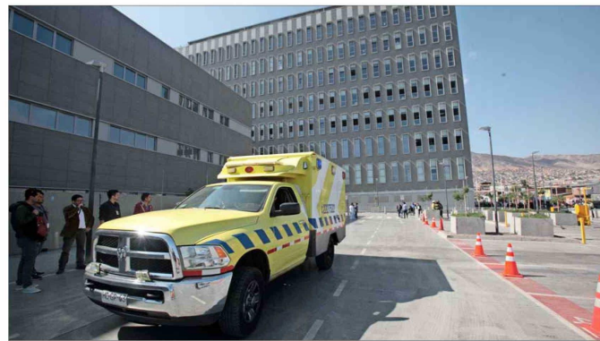
AUDITORÍA. — La investigación de la Contraloría se está llevando a cabo en otros nueve recintos del país para evaluar la calidad de los registros del sistema público de salud. En la imagen, el hospital de Antofagasta.

Sobre el impacto de este hallazgo, advierte que “hace más