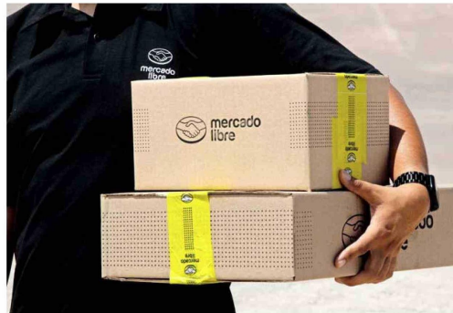
Mercado Libre Extra es una solución tecnológica que busca integrar repartidores independientes para complementar el sistema de envíos.

En tanto, a lo largo del país cuenta con más de 14 Service Centers o centros de distribución zonal, que complementan la operación de Fulfillment. En este tipo de centros, los productos que llegan se despachan inmediatamente a varios destinos y rutas, reduciendo así al máximo el tiempo de depósito y optimizando el tiempo de distribución posterior a la venta. Otra modalidad son los centros de crossdocking , desde donde empresas logísticas