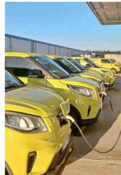
En Chile, la firma ya tiene una flota de 300 vehículos eléctricos.