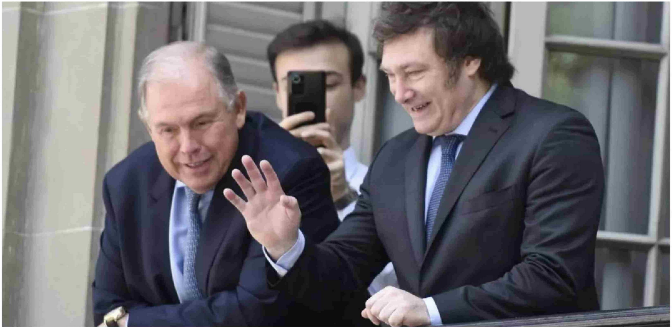
► Gerardo Werthein, que se desempeña hasta ahora como embajador en EE.UU., y el presidente Javier Milei.