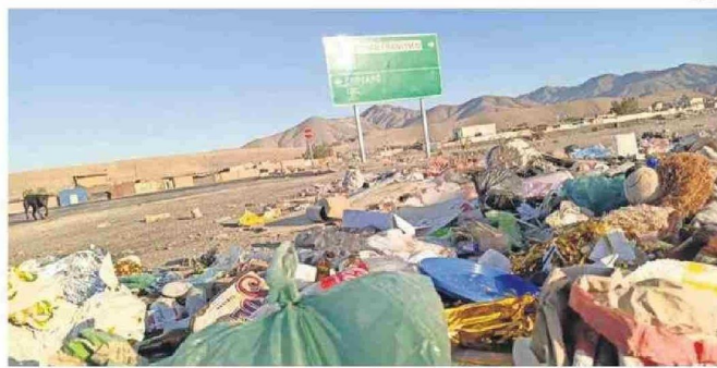
DURANTE SUS VISITAS EL GREMIO DE TURISMO DE CALDERA SE ENCONTRÓ CON UN BASURAL CERCA DEL PASO.

La coordinadora de turismo de Caldera, comentó que a los turistas "se les hace difícil porque a veces quieren ir a Copiapó y toman el otro camino, porque justamente las señaléticas no están en la parte adecuada o no tienen una visibilidad correcta y eso genera confusiones a la llegada y alarga, por supuesto, sus viajes".