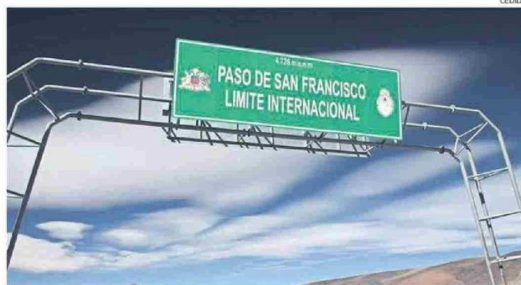
SE ESTIMA QUE MÁS DE MIL PERSONAS CRUZARON ESTE MARTES POR LA FRONTERA ATACAMEÑA.