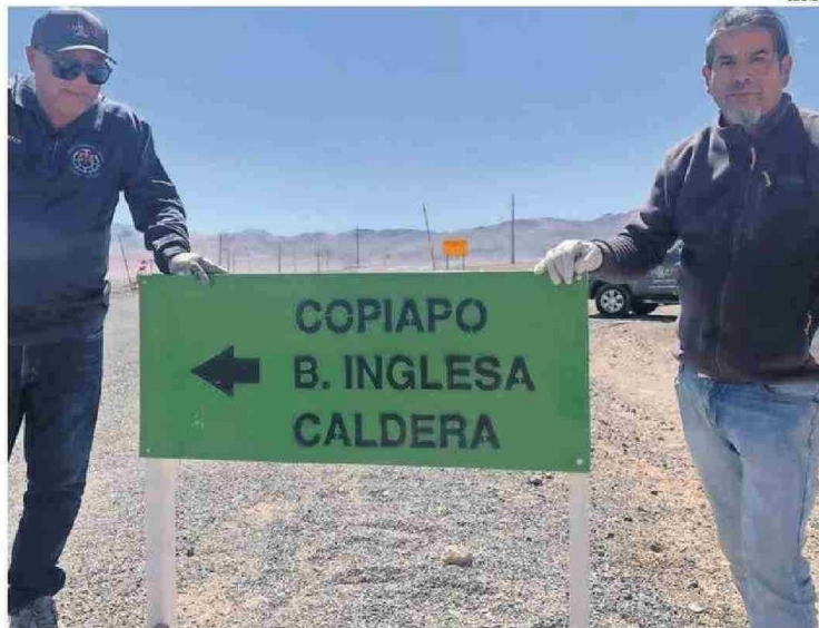
LOS GREMIOS DE TURISMO DE CALDERA INSTALARON UN LETRERO PROVISORIO CERCA DEL PASO.

Además, la autoridad regional aclaró que “hemos llegado a un acuerdo en lugar en que se podría emplazar este proyecto, pero aquí necesitamos que la unidad de paso fronterizo del Ministerio del Interior