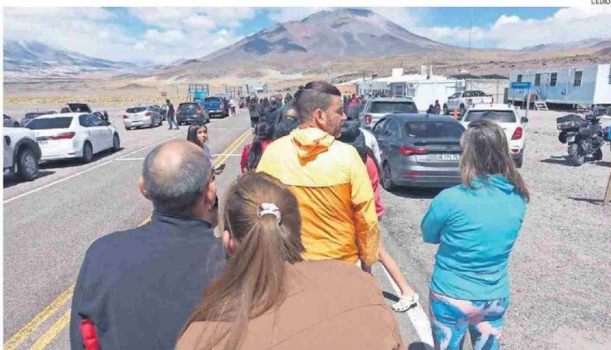
HASTA 6 HORAS DE ESPERA TUVIERON LOS VISITANTES EN EL PASO SAN FRANCISCO DURANTE EL MARTES.