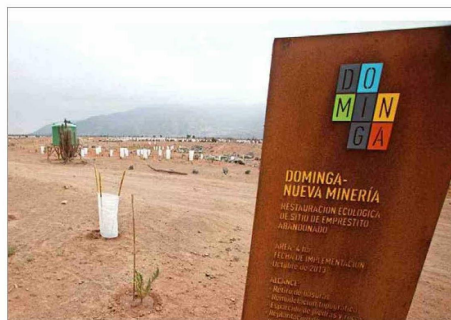
Es tercera vez que un Comité de Ministros se pronunciará sobre el proyecto minero-portuario Dominga.

En este sentido, quien debiese asistir a la reunión por parte de la cartera de Salud es la subsecretaria de Salud Pública, An-