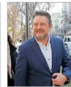
Gobierno regional suscribió contrato con fundación investigada.

REFORMA AL SISTEMA DE NOMBRAMIENTOS INGRESA HOY: MINISTERIO DE JUSTICIA PROPONDRÁ CONSEJO PERMANENTE DE CINCO MIEMBROS Y MANTENER LOS CUPOS DE SUPREMOS "EXTERNOS" | C 2