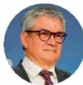
MARIO MARCEL, ministro de Hacienda

Hay que tener bastante prudencia para interpretar los datos de un mes y otro. Y así como con motivo de un mes que fue más bajo, no bajamos la proyección, ahora tampoco la vamos a incrementar”.