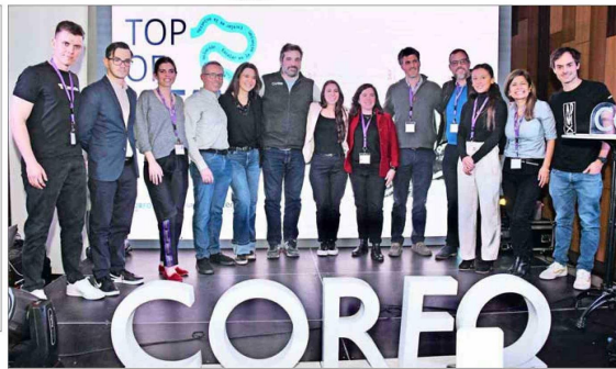
Los jueces, ganadores y participantes del Demo Day de Top of Latam.