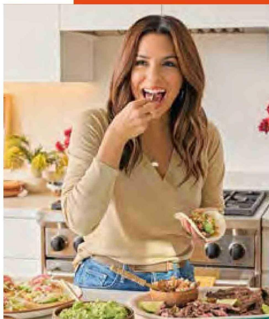
Eva Longoria hace detox de azúcar cada 30 días. Mientras que Miley Cyrus cortó su consumo para potenciar los resultados de su plan de ejercicios.

Por aquello es importante ir a una cita ginecológica para pedir el reemplazo hormonal y un acompañamiento en el proceso. ¡Todo es positivo con el inicio del tratamiento! En la consulta tendrás respuestas a una infinidad de dudas respecto a esta etapa y, de paso, la piel de tu cara lo va agradecer.