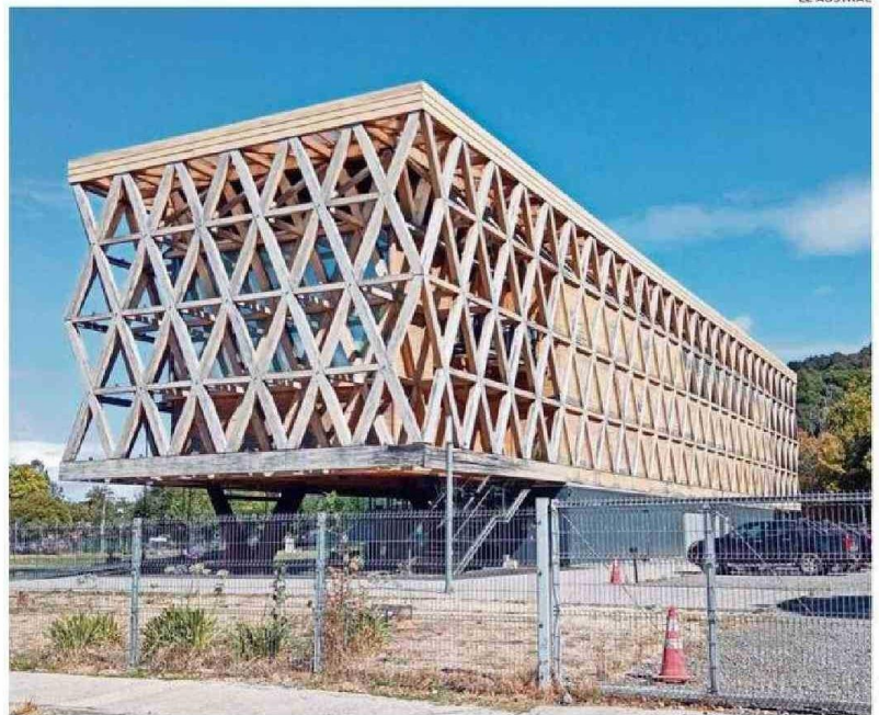
EL PABELLÓN ARAUCANÍA YA MUESTRA DETERIORO EN BUENA PARTE DE LOS MADEROS QUE LO CONFORMAN.