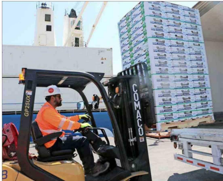
En 2024, las exportaciones lograron el récord de superar por primera vez los US$ 100.000 millones, principalmente por la venta de cobre y de frutas.

En 2024, los envíos a este grupo de naciones crecieron un 10% y sumaron US$ 14.133 millones, por encima de la Unión Europea y el Mercosur. El ingreso de Reino Unido abre nuevas opciones para 2025, dicen expertos.