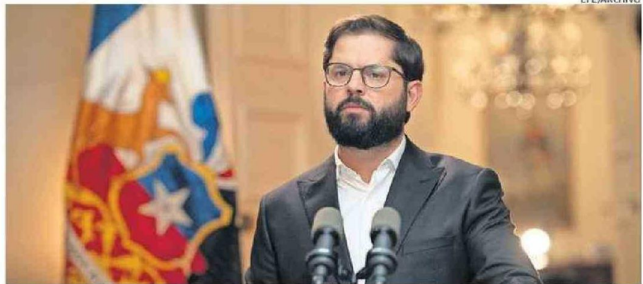
PRESIDENTE BORIC DIJO QUE “LA GUERRA LA PAGAN LOS MÁS HUMILDES”, TRAS ANUNCIO DE VUELO HUMANITARIO.

De acuerdo a las cifras de la Agencia de Naciones Unidas para los Refugiados (ACNUR), más de 200 mil personas han abandonado dicho