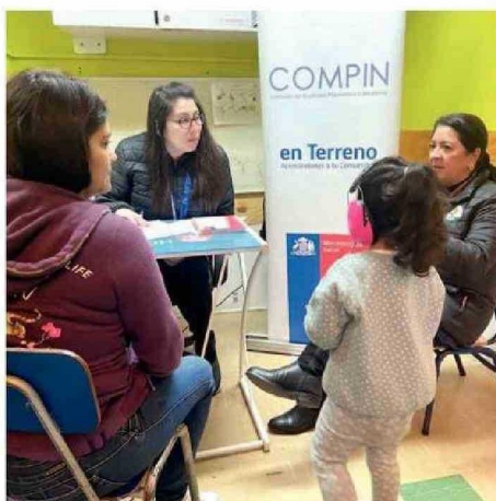
SE EVALUÓ EL GRADO DE DISCAPACIDAD DE LOS NIÑOS.

“A partir de esta resolución de discapacidad emitida por Compín, las