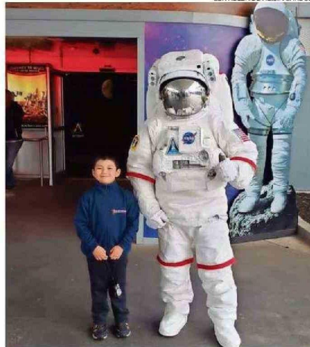
VIVIERON DE CERCA EXPERIENCIAS VINCULADAS CON EL ESPACIO.

En tanto, explicó que "la disponibilidad de datos a nivel comunal y por establecimiento, como a su vez la posibilidad