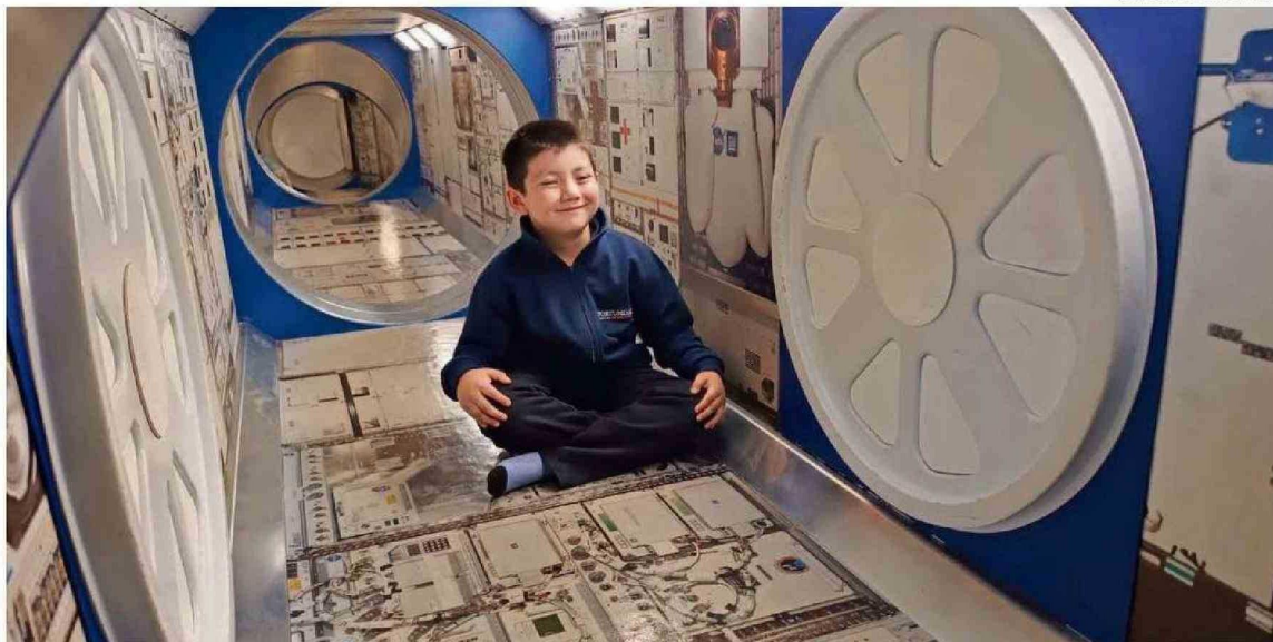
SU BUENA ASISTENCIA AL KÍNDER LE PERMITIÓ AL ALUMNO DEL COLEGIO PRÍNCIPE DE ASTURIAS DE VALDIVIA VIAJAR A CONOCER EL CENTRO ESPACIAL.

del concurso "Haz que despeguen" se realizará este 2025. Su lanzamiento será durante las primeras dos semanas de marzo, según indicaron desde la Fundación.