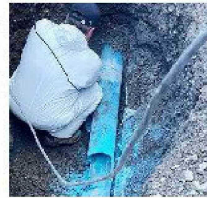
Rotura de matriz de agua provoca emergencia en el Hospital Regional.