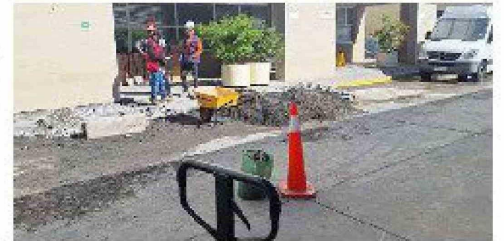
La rotura en la matriz de agua potable fría fue en la calle J, lo que desató una emergencia que obligó a suspender los labores regulares del recinto hospitalario.