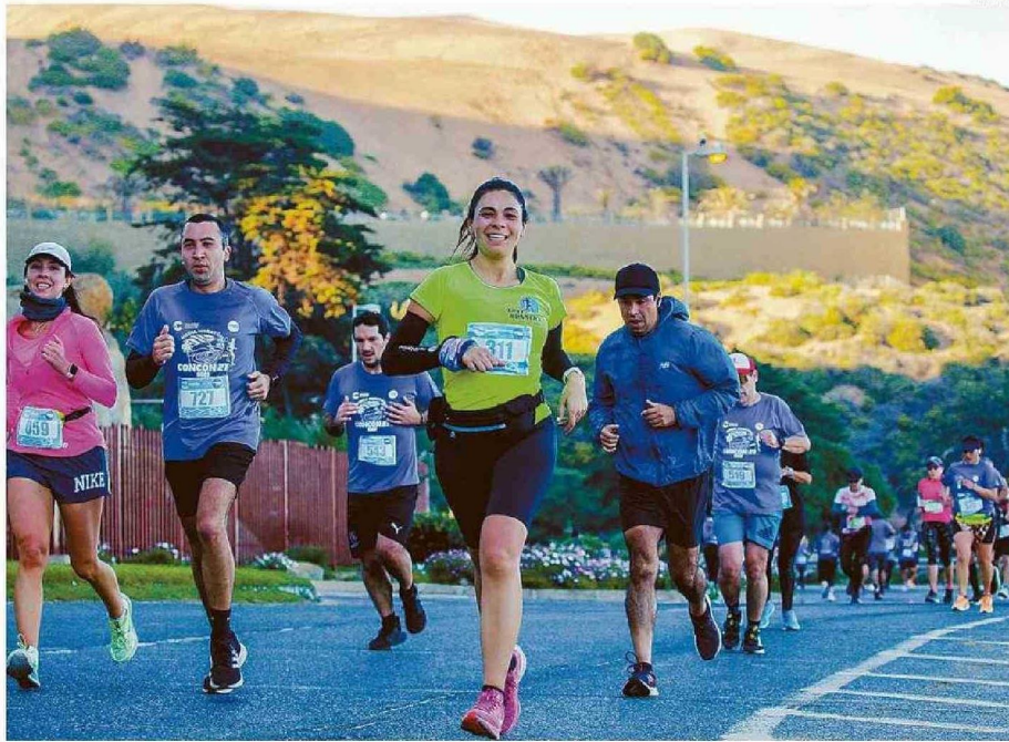
LA COMUNA DE CONCÓN ESTÁ ENTRE LAS MEJORES DEL PAÍS EN CUANTO A CALIDAD DE VIDA URBANA.

Ya con la mira local, entre las comunas de áreas metropolitanas de la Región de Valparaíso, Concón se mantiene en el nivel "alto" en cuanto a calidad de vida urbana, mientras que Viña del Mar, Quilpué y Vi-