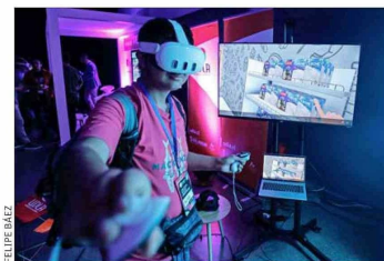
La UDLA exhibió una aplicación de realidad virtual que ayuda a personas de la tercera edad con deterioro cognitivo. Todos los asistentes la pueden probar.