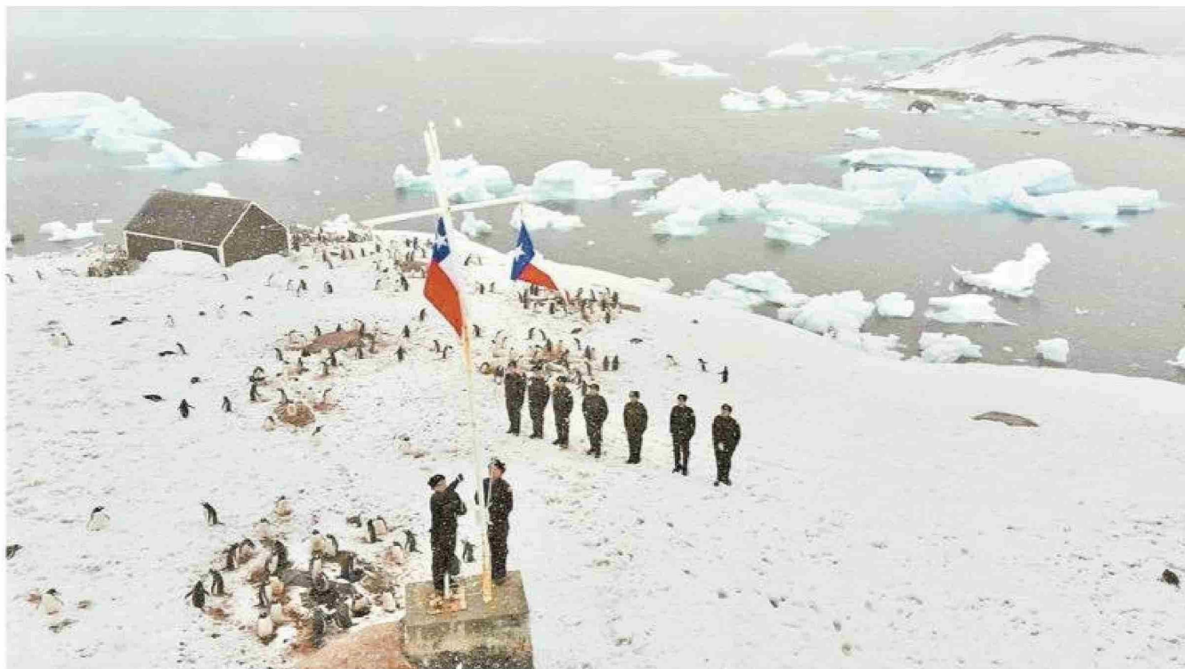
Luego de la construcción de la primera base chilena en 1947, diferentes instituciones decidieron acrecentar la presencia de Chile en la Antártica. Es así que hoy el país mantiene bases y refugios en diferentes lugares de su territorio antártico.