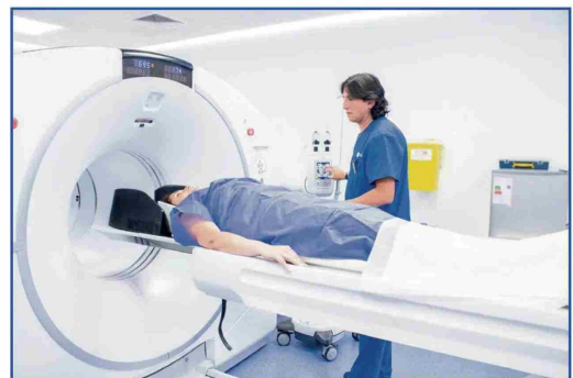
PET-CT Clínica Andes Salud Concepción y Puerto Montt

país existe un déficit de 13.600 tratamientos de radioterapia al año y se requieren al menos 11 aceleradores lineales adicionales para responder a la demanda actual. Dos de éstos, con tecnología de última generación, serán provistos por Andes Salud.