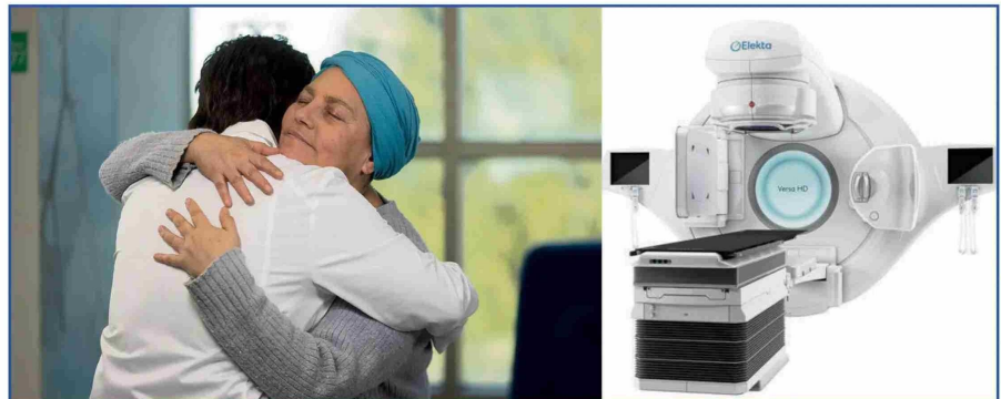
Equipo de Radioterapia que estará en funcionamiento en 2026

Con una inversión total de US$36 millones , la Clínica Andes Salud de Talca será la más grande de la región del Maule al considerar 92 camas totales , incluyendo una Unidad de Pacientes Críticos (UPC) con 18 camas intensivas , que aumentará significativamente la capacidad de atención a pacientes de mediana y alta complejidad. Así mismo, contará con 6 pabellones quirúrgicos y un Servicio de Urgencia de primer nivel , lo que incrementará la capacidad para realizar cirugías, esenciales para reducir las listas de espera que han afectado a la región y mejorará la atención de emergencias médicas. También se