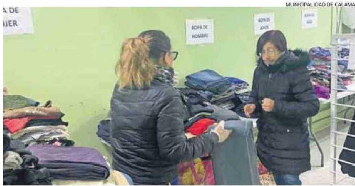
EL ROPERO SOLIDARIO ES UNA DE LAS INICIATIVAS QUE SE ORGANIZAN PARA ESTE INVIERNO EN CALAMA.

En todos estos casos se necesita la colaboración de los calameños, quienes con un pequeño aporte, pueden ayudar a cambiar en algo la vida de quienes más lo necesitan durante este invierno en la comunidad.