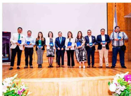
Distinción especial denominada "Aporte a la Gobernanza"