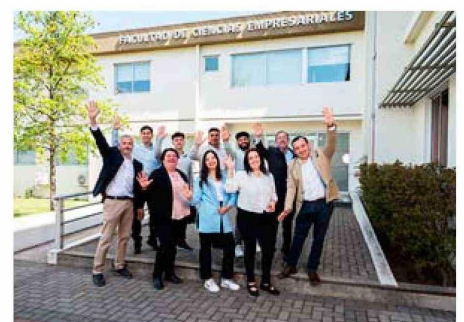
Equipo de trabajo FPpyME Ñuble