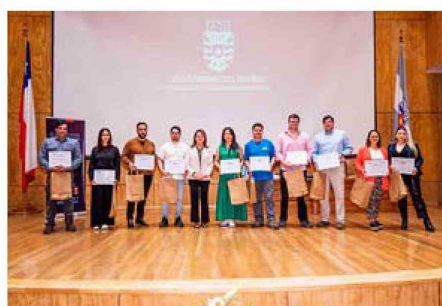
Premio FPpyME reconocimiento "Líderes en Transformación Digital"