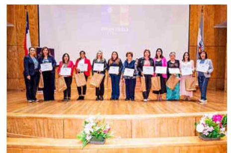
Premio FPpyME reconocimiento "Mujeres en la Transformación Digital"