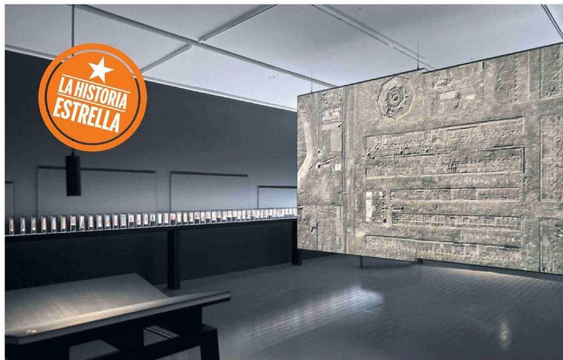
EXPOSICIÓN CHILEHAUS EN EL CENTRO CULTURAL LA MONEDA

A través de archivos, videos, fotografías, sonidos y postales recopiladas entre Alemania y Chile, esta muestra explora la relación entre el edificio Chilehaus y la industria del salitre instalada en el desierto de Atacama a principios del siglo XX.