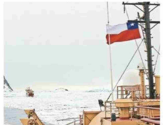
Expedición en el mar de Bellingshausen a bordo del rompehielos Almirante Oscar Viel de la Armada de Chile, al oeste del Territorio Chileno Antártico. Año 2014.

fíos inherentes a esta compleja tarea, la importancia de estudiar estas áreas inexploradas del lecho marino motiva los notables esfuerzos de Chile en las últimas dos décadas. El propósito subyacente de estos esfuerzos reside en la determinación y anexión de nuevas porciones del lecho marino al dominio soberano nacional.