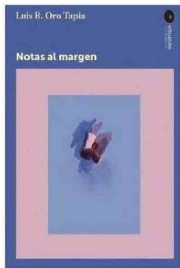
EL LIBRO "NOTAS AL MARGEN" REFLEXIONA SOBRE EL MOMENTO POLÍTICO Y SOCIAL ACTUAL Y SOBRE EL ROL DE LA GENERACIÓN DE LOS 80.