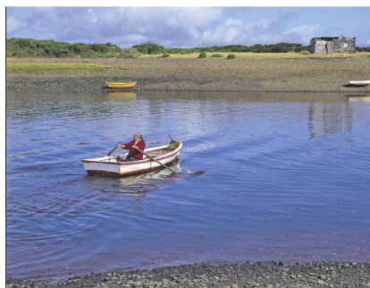
Clave. Las comunidades aledañas a las áreas protegidas son de vital importancia para generar desarrollo sostenible compatible con la conservación. / CALETA CHANA, REGIÓN DE LOS LAGOS.

En el marco de este desafío (y del Día de las Áreas Protegidas de América Latina y el Caribe, que se celebra el 17 de octubre), este lunes se hará el IV Encuentro de Áreas Protegidas y Comunidades en el Centro Cultural palacio de La Moneda, con la participación de actores pú-