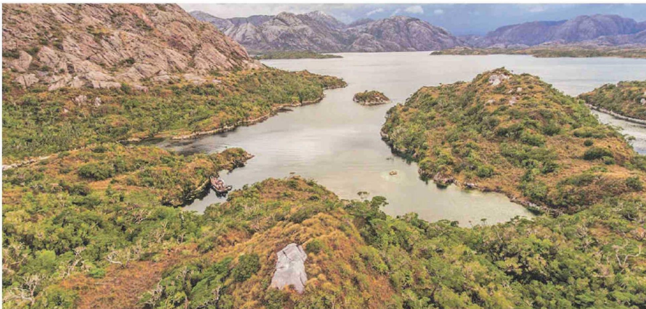
Desafíos. La reserva nacional Kawésqar tiene un guardaparque para una superficie del tamaño de Bélgica.

Esta será la misión del nuevo Servicio de Biodiversidad y Áreas Protegidas (SBAP), creado en 2023 con el desafío de administrar un sistema nacional de todas las áreas protegidas —que actualmente se encuentra disperso en cinco ministerios distintos— y lograr fortalecer su desarrollo para el beneficio de estas y las comunidades.