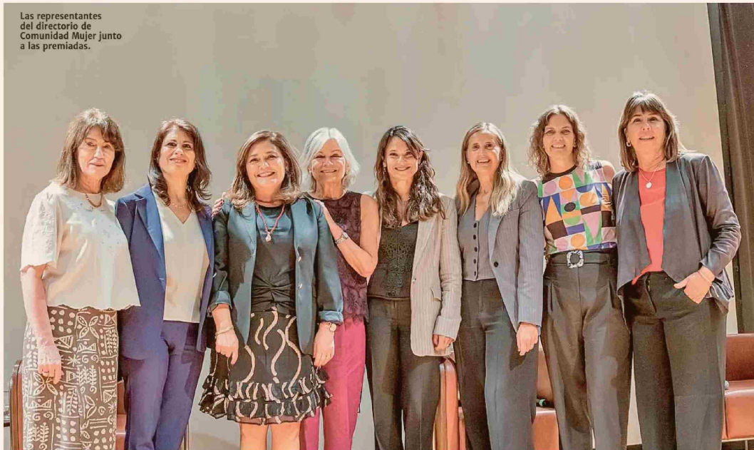
Las representantes del directorio de Comunidad Mujer junto a las premiadas.

"Necesitamos un mundo más diverso, porque cuando todas las cosas vienen de un solo lado y solo se miran con unos ojos, hay problemas que se dejan de ver, hay soluciones que se dejan de ofrecer", dijo Repetto.