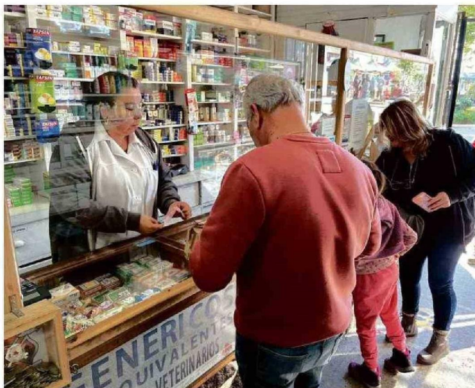
LA ATENCIÓN Y LOS PRECIOS CONVENIENTES SIGUEN ATRAYENDO A LOS CLIENTES.

-Sí, antes del verano teníamos que tener los papelillos de amarillo vegetal que compraban para hacer el pan de huevo, pesar el bicarbonato y el amoníaco. Mi papá usaba una mesa grande que tenía en el recetario. Compraba papel mantequilla, cortaba unos sobrecitos cuadrados y nosotras con mis hermanas hacíamos los papelillos que quedaban cuadraditos y quedaban metidos al medio. Una los doblaba, la otra les iba poniendo la etiqueta, el timbre que decía 'Amarillo vegetal' y los guardábamos en una caja con 200 ó 300, para todo el verano. Era entretenido, los papelillos de flores expectorantes también los teníamos que envasar.