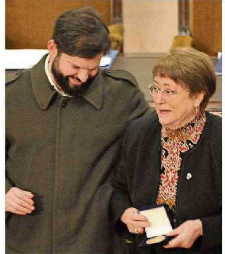
EL PRESIDENTE BORIC JUNTO A LA EXPRESIDENTA BACHELET, AYER, EN UN ACTO DEL CONSEJO DE RECTORES.