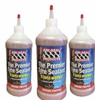
Los sellantes antipinchazos de la compañía son seguros para los neumáticos y el medio ambiente.