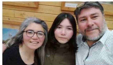
LA BRILLANTE ESTUDIANTE JUNTO A SUS PADRES.

“Los municipios de Dalcahue y Castro están interesados en esta aplicación y hemos tenido conversaciones al respecto, lo que nos tiene muy contentos”, agre-