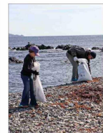
Más de 9 toneladas de basura fueron retiradas desde Chañaral de Acetum, en Atacama, caleta de interés turístico por ser uno de los principales puntos de avistamiento de ballenas del país. | C 10

Laguna de Aculeo presenta importante recuperación Luego de los sistemas frontales en la zona centro sur, las precipitaciones acumuladas han logrado revivir lagunas y embalses desaparecidos por la sequía. Entre ellas la laguna de Aculeo, en Paine, que presenta actualmente cerca de un 60% de su capacidad total. Ello ha provocado también la reaparición de las aves y otra fauna del sector. De todas formas, expertos advierten que, por su dependencia de las lluvias, podría volver a secarse. | C 11