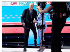
La primera dama, Jill Biden, tuvo que ayudarlo a bajar los pequeños escalones del escenario tras el evento.

Preocupación entre demócratas: La opción de sustituir a Joe Biden toma fuerza en su partido tras mal desempeño en debate