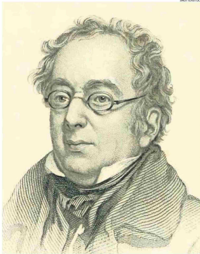
ISAAC DISRAELI PUBLICÓ “CURIOSIDADES DE LA LITERATURA” EN CUATRO TOMOS, ENTRE 1791 Y 1823.

cuatro volúmenes publicados entre 1791 y 1823, aunque la edición chilena está tomada del primer tomo, así que “esto puede que siga”, ríe González, junto con agregar que el autor “describe distintos aspectos de los clásicos, la cultura escrita, también como un pedagogo, a través de su propia opinión, ácida, mordaz y humorística, con la que va entrando en las masas lectoras inglesas con un lenguaje más llano, por eso fue tan popular”.