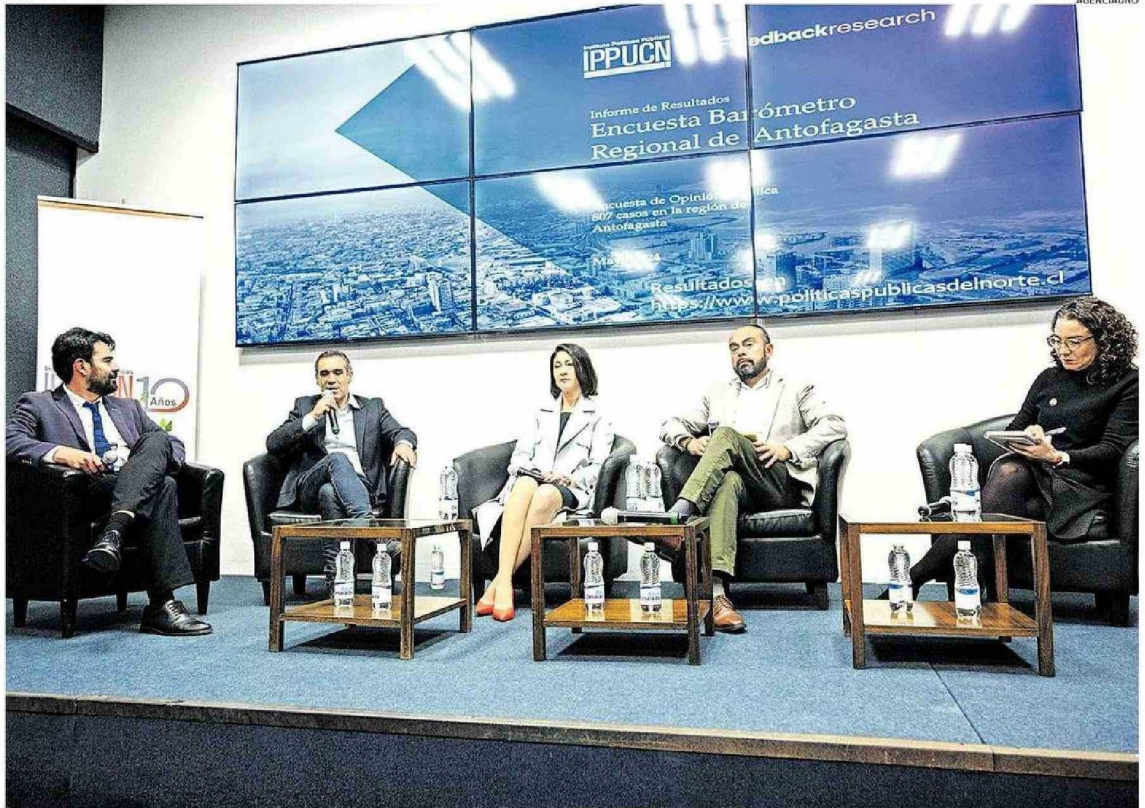
LOS RESULTADOS DE LA ENCUESTA BARÓMETRO REGIONAL DE ANTOFAGASTA DEL IPP DE LA UCN FUERON PRESENTADOS AYER EN EL AUDITORIO DE EL MERCURIO DE ANTOFAGASTA.

Mientras que respecto a los resultados comunales. En el caso de Antofagasta, ante la pregunta: ¿por cuál de los siguientes candidatos votaría usted para alcalde de Antofagasta?, con una lista cerrada de 22 candidatos, un 59,7% respondió que no sabe o no responde, mientras