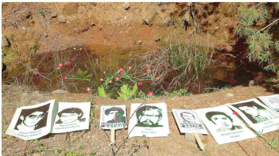
Una fosa en el predio de la Colonia Dignidad.

Tiraje: Lectoría: Favorabilidad: Sin Datos Sin Datos No Definida