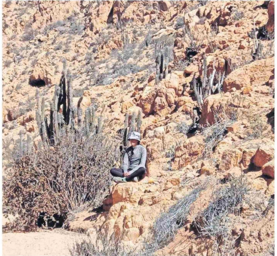
LA ZONA TIENE MAYOR VEGETACIÓN Y CONCENTRACIÓN DE BIODIVERSIDAD, ADEMÁS DE SER UN SITIO LIBRE DE CONTAMINACIÓN ACÚSTICA.

El sentido es brindar un servicio complementario a la salud tradicional, pues el contacto con espacios naturales no sólo relaja, mejora la concentración y el ánimo, sino además hay estudios que acreditan que ayuda a regular el sueño, reduce el estrés y fortalecer el sistema inmune.