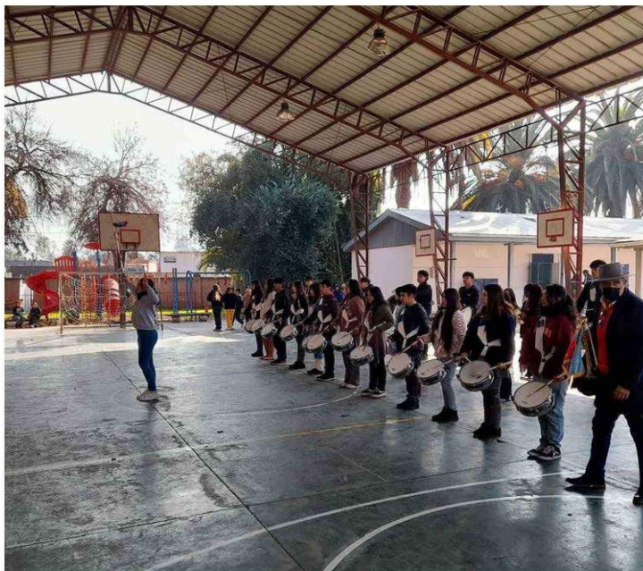
La invitación es extensiva para los recintos educacionales que cuentan con su Banda de Guerra.