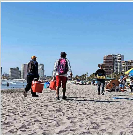
IQUIQUE. —Los vendedores ofrecen desde micheladas hasta mojitos en la playa Cavancho.

Locales que funcionan legalmente piden intensificar las fiscalizaciones, mientras campea la falta de resguardos sanitarios y se alerta por el riesgo para bañistas.