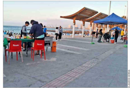
ANTOFAGASTA. —Comerciantes ambulantes instalan parrillas en las tardes en el balneario municipal de Antofagasta.

Cada tarde en el balneario municipal de Antofagasta comienzan a instalarse ambulantes, sobre todo dedicados a la venta de comida preparada en parrillas o cocinillas que humean sus preparaciones. Una esce-