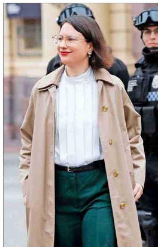
Irací Hassler (PC), alcaldesa de Santiago.

en medio de una disputa electoral para concretar su reelección— sostuvo que ha tenido conversaciones con parlamentarios de su distrito. Su aspiración es que se concrete un beneficio para el 80% de las familias más vulnerables del Registro